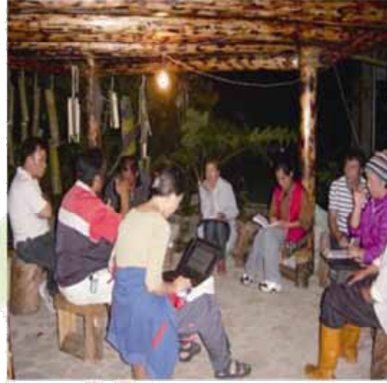
社區居民定期開會議討論生態旅遊運作機制