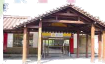
梨山遊客服務中心