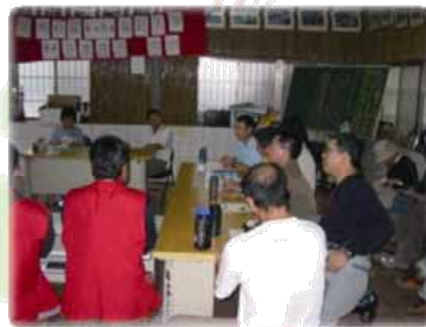
社區居民定期開會議討論生態旅遊運作機制