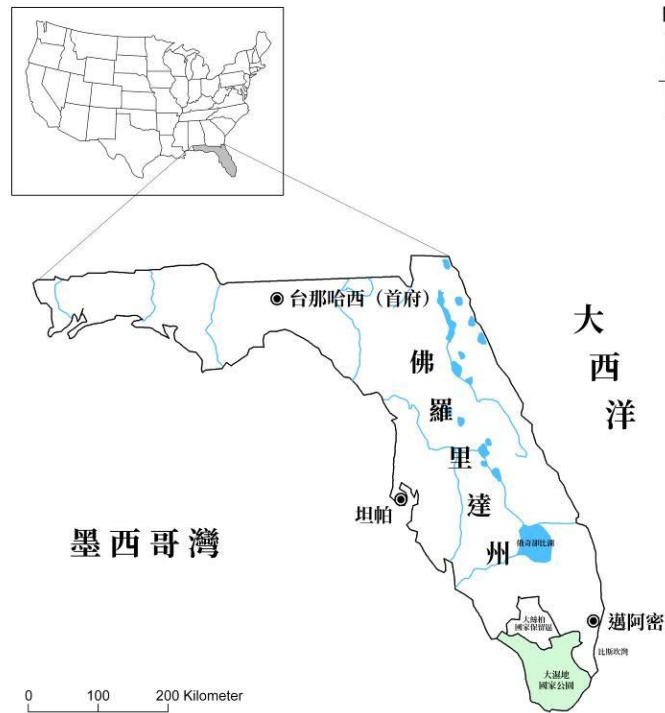
圖 1. 佛羅里達濕地生態系統位置圖(本研究繪製)